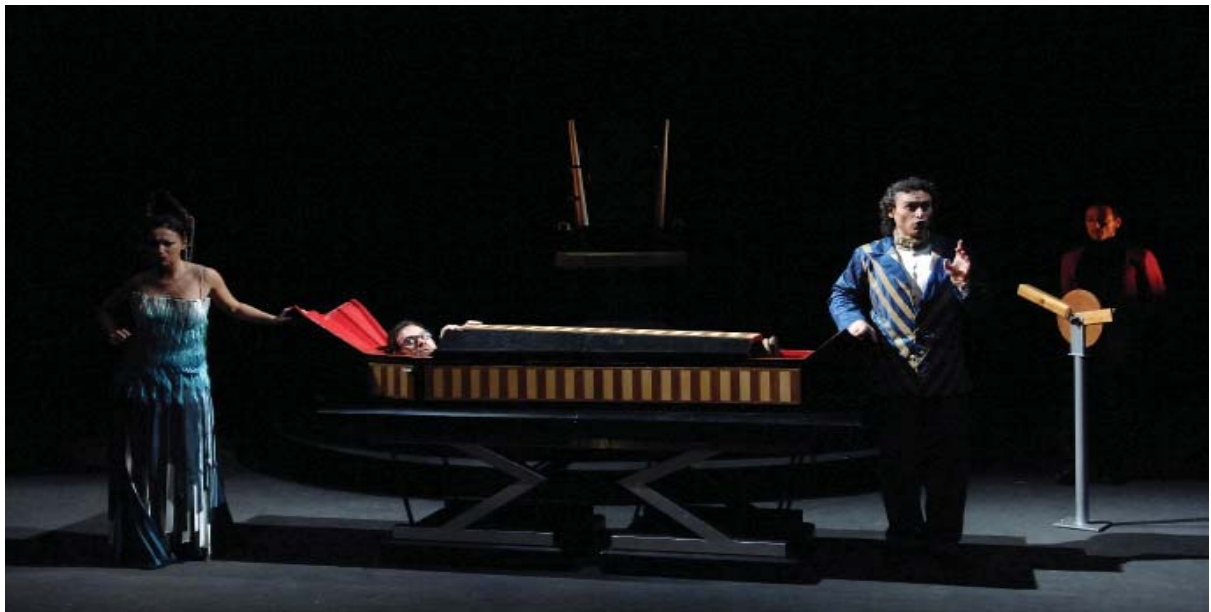
Representació de Saló d'Anubis (2005) ©David Ruano

víctima de les seves circumstàncies. I La cabeza del bautista (també obra de Palomar, 2009) adapta l'obra de teatre homònima de Valle-Inclán. Les nou funcions que va oferir el Liceu van sumar un total de més de 15.000 espectadors. Encara que aquesta obra no és una producció d'Òpera de Butxaca, és hereva de la seva trajectòria i filla dels ponts que el Gran Teatre va establir amb els creadors de nova producció.