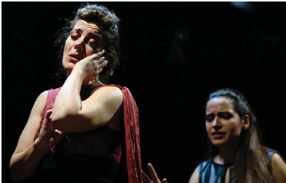
Un moment de Dido & Aeneas Reloaded (2013)

El suport a aquests joves artistes representa la creació de noves obres. Òpera de Butxaca cultiva des del seu naixement un àmbit