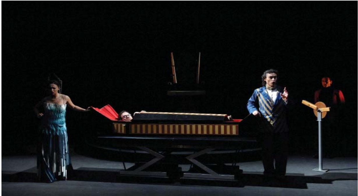
Representación de Saló d'Anubis (2005)

“Juana la loca” y la sitúa como una víctima de sus circunstancias. Y La cabeza del bautista (también obra de Palomar, 2009) adapta la obra de teatro homónima de Valle-Inclán. Las nueve representaciones que ofreció el Liceo sumaron más de 15.000 espectadores. Aunque esta no es una obra de Òpera de Butxaca, es heredera suya e hija de los lazos que el Gran Teatre ha establecido con los creadores de nueva producción.